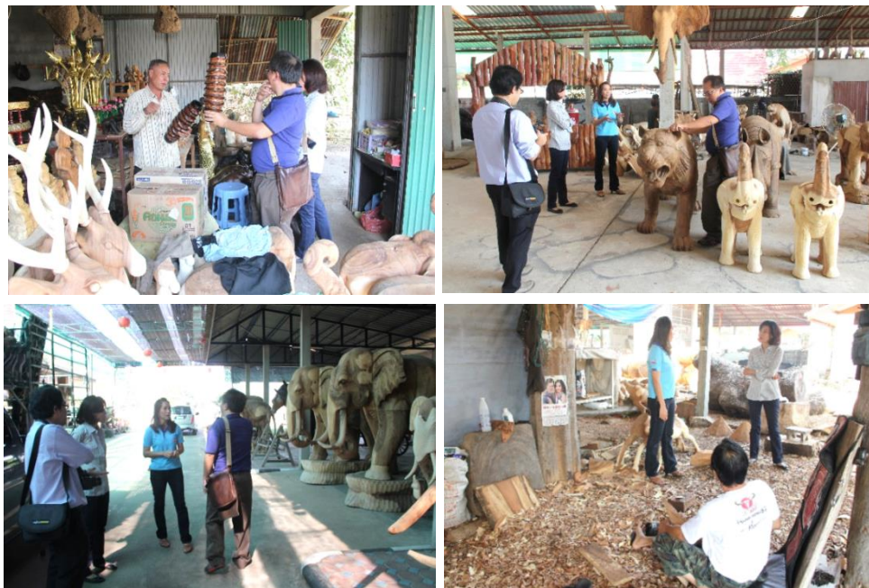
ภาพที่ 1.1 การลงพื้นที่เพื่อหาข้อมูลเบื้องต้นในการศึกษาโดยลงพื้นที่เพื่อสำรวจหมู่บ้านแกะสลักบ้านหลุก ต.นาคร้ว อ.แม่ทะ จ.ลำปาง (ลงพื้นที่วันที่ 25 มีนาคม 2564)

นอกจากประเด็นการออกแบบข้างต้น ผู้ปฏิบัติงานได้วิเคราะห์แนวโน้มของการออกแบบผลิตภัณฑ์ (Trend) เพื่อพัฒนาผลิตภัณฑ์ให้สอดคล้องและตรงตามความต้องการของตลาดในอนาคตมากที่สุด เพื่อให้เชื่อมั่นได้ว่าสินค้าจะขายได้จริงในตลาดเป้าหมาย และทำการศึกษา เก็บรวบรวมข้อมูลที่เกี่ยวข้องกับปัจจัยและเงื่อนไขในการพัฒนา, การเก็บข้อมูลเพื่อใช้ในการวิเคราะห์สำหรับการออกแบบสร้างสรรค์, กฎเกณฑ์และตัวชี้วัดที่สำคัญสำหรับการประเมิน เพื่อได้ข้อมูลใช้เป็นแนวทางทางการออกแบบและพัฒนาผลิตภัณฑ์ให้สอดคล้องกับอุตสาหกรรมในจังหวัดลำปาง อันส่งผลสอดคล้องกับแผนยุทธศาสตร์และแผนพัฒนาของจังหวัดลำปาง