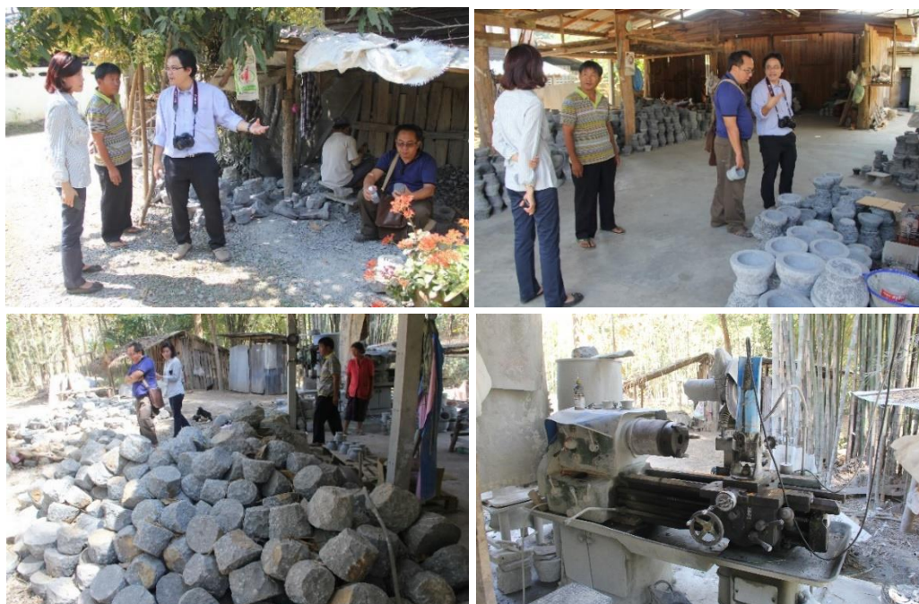
ภาพที่ 1.2 การลงพื้นที่เพื่อหาข้อมูลเบื้องต้นในการศึกษา โดยลงพื้นที่เพื่อสำรวจ ชุมชนบ้านไร่ศิลาทอง ต.พิชัย อ.เมือง จ.ลำปาง โดยได้รับความร่วมมือจากผู้ใหญ่บ้านชุมชนบ้านไร่ศิลาทอง ซึ่งชุมชนดังกล่าวเป็นชุมชนที่ประกอบอาชีพแกะครกหิน และเกษตรกรรม ปัจจุบันภายในชุมชนยังประกอบอาชีพแกะครกหินอยู่เป็นจำนวนมาก แต่รูปแบบและแนวคิดในการพัฒนายังไม่สามารถตอบโจทย์ที่เหมาะสมกับทรัพยากรที่สูญเสียไปเท่าที่ควร ซึ่งผู้ปฏิบัติงานเห็นว่าวัสดุหินดังกล่าวสามารถแปรเปลี่ยนและเพิ่มมูลค่าได้อีกมากมายและหลากหลาย รวมถึงเศษหินที่เหลือจากการผลิตครกหินที่มีจำนวนมาก สามารถนำมาใช้ในการพัฒนาและออกแบบได้เช่นกัน